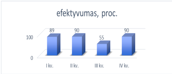
Efektyvumo proc. ketvirčiais