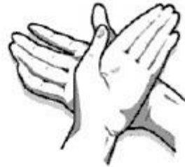
2. Dešinėsios rankos delnu trinamas kairiosios plaštakos viršus.