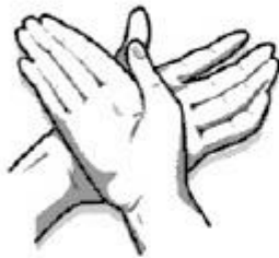
3. Kairiosios rankos delnu trinamas dešinėsios plaštakos viršus.