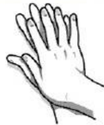
4. Suglaudžiami delnai, supinami pirštai ir trinami.