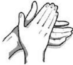
1. Delnas trinamas į delną.