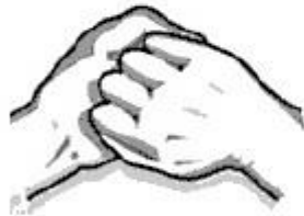
5. Kiekvienos rankos delnu trinami kitos rankos pirštai.